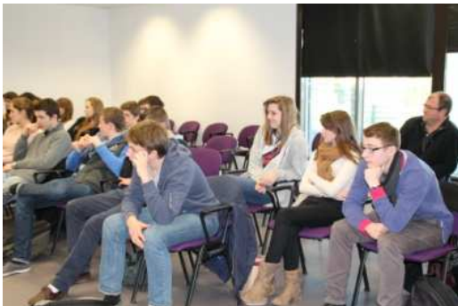
Journées orientation 2014